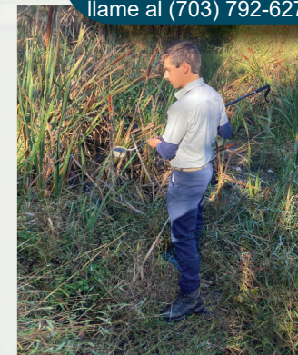
Un biólogo busca larvas.

Para obtener más información sobre el control de mosquitos, visite www.pwcva.gov/mfpm , o llame al (703) 792-6279.