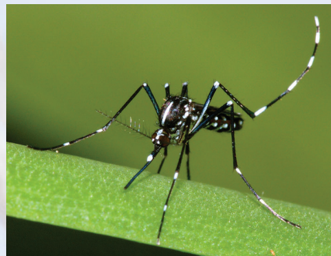
Mosquito tigre (hembra adulta)

CONTROL: Extremadamente difícil de controlar. Pueden usar casi cualquier cosa que contenga agua como hábitat larval. La fumigación de insectos adultos es ineficaz para controlar las poblaciones.