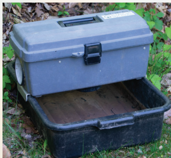
Las trampas para grávidas capturan hembras adultas.

¿Qué hace el Condado? En el MFPM monitoreamos las poblaciones de mosquitos adultos para el WNV e implementamos un control extenso de larvas y adultos en los puntos críticos de WNV.