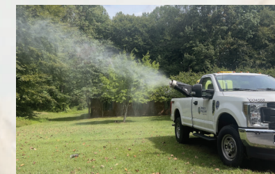
Rociador WALs aplicando larvicida.