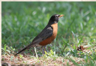
Las aves son el reservorio principal del WNV.