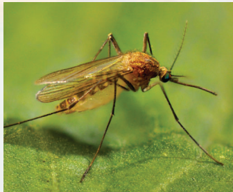
Los mosquitos Culex son el vector principal del WNV.

¿Qué es el virus del Nilo Occidental (WNV)? WNV es un virus transmitido por artrópodos (arbovirus) que se transmite más comúnmente por la picadura de mosquitos infectados. La infección por el WNV puede provocar síntomas febriles y neuroinvasivos graves. Estamos en riesgo de contraerlo en el condado de Prince William.